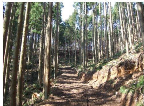
(搬出作業路開設状況)